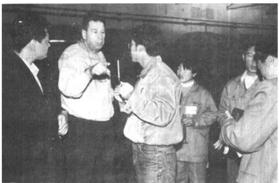
全市政法系统“三整一促”活动 加强检查整改阶段督查调度工作

本报讯 截至11月4日，我市已收购皮棉15.29万担，为去年同期的134.59% 完成省下达计划的40.24% 进度居全省八大棉区第一位。 为保质保量地收购好棉花，在各级党委政府的统一领导下，有关部门通力合作，注意及时发现问题、解决问题，为各级供销社和棉麻企业排忧解难，使全市的棉花收购工作出现了市场稳、质量好、进度快的局面。一是思想上不松劲。各级党委政府和供销社，一如既往地坚持把棉花作为关系国计民生的战略物资，一丝不苟地抓收购。二是资金到位及时。到10月底，农行及时协调与上级行的关系，已投入收购资金1.16亿元；供销社系统清理新老挪用资金1188万元，调回贷款资金1500万元。全市共筹集收购资金1.4288亿元。三是质量价格把握合理。各收棉站点认真执行国家质量标准，严格“一统五定”、密码验收的操作规程，既不提级提价，也不压级压价。坚决杜绝“人情棉”、“关系棉”。四是服务工作主动。各棉站继续开展了“满意在棉站”活动，设立了车辆维修点、饮水处、咨询处，指导棉农搞好“四分”（分摘拾、分晾晒、分储存、分交售），为棉农提供晾晒场地，努力做到收购不过夜，随到随收。五是加强了市场管理。全市继续实行了棉花收购加工发放“许可证”制度，制止了擅自收购加工棉花的不法行为。公安、工商、供销社、棉检等部门协同动作，加强了边界稽查工作，有效地控制了棉花外流现象。 （曹亚兴 李国华）