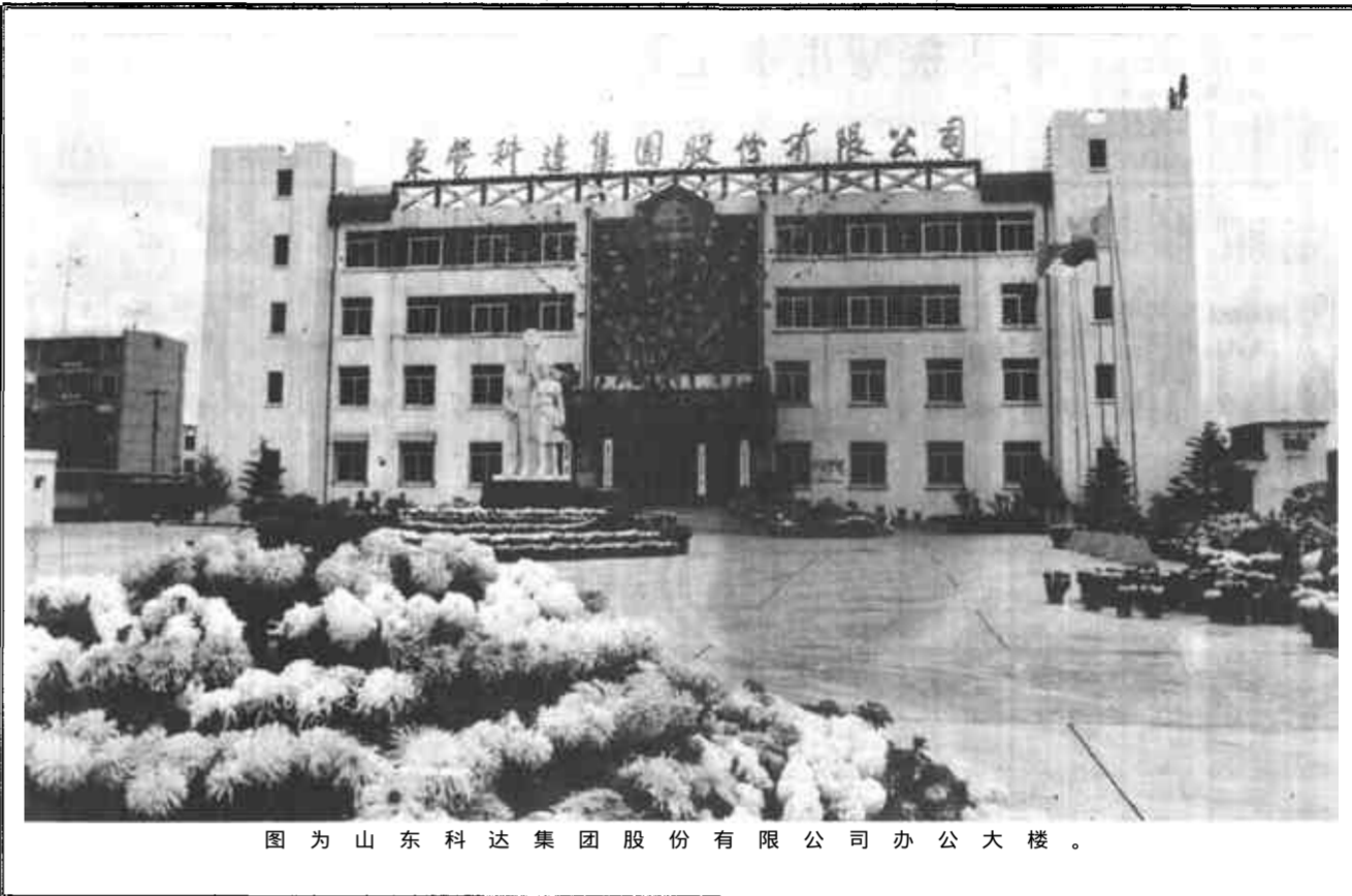
图为山东科达集团股份有限公司办公大楼。

山东科达集团股份有限公司位于广饶县大王镇境内潍高路与青垦路交汇点西北隅，占地面积10万平方米，拥有固定资产8809万元，在册职工1352人。地灵昭人杰，武圣亮光辉，科达人将秉承励精图治、拼搏进取的一贯精神，与各界朋友共创辉煌成就，携手走向灿烂的明天。